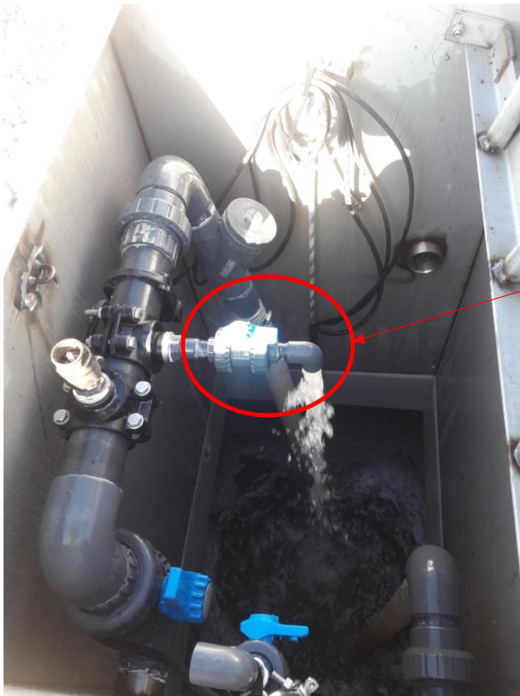
Vanne de prélèvement