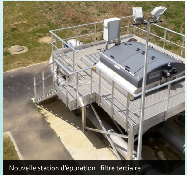
Nouvelle station d'épuration : filtre tertiaire